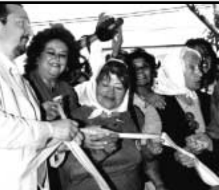
Inauguración Casa de la Mujer