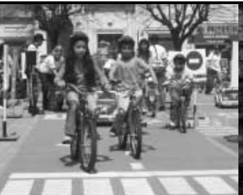
Campañas de educación vial