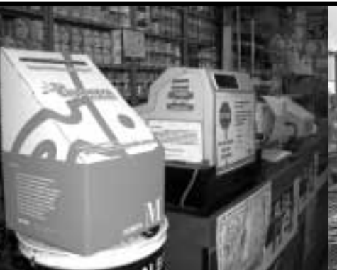
Promoción del comercio local