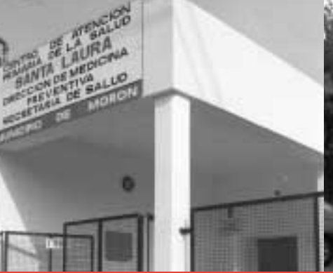
Nuevo centro de salud