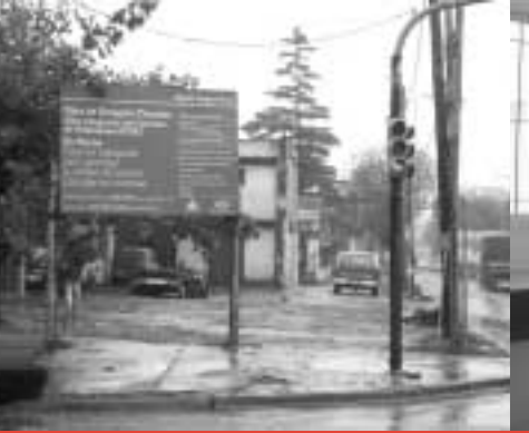
Extensión de la red cloacal