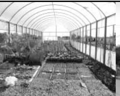
Construcción del vivero municipal