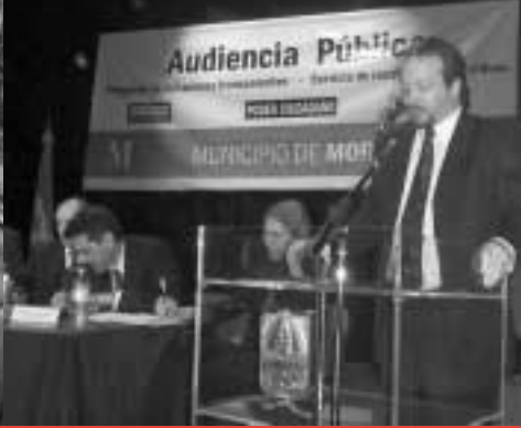
Audiencia pública por la recolección