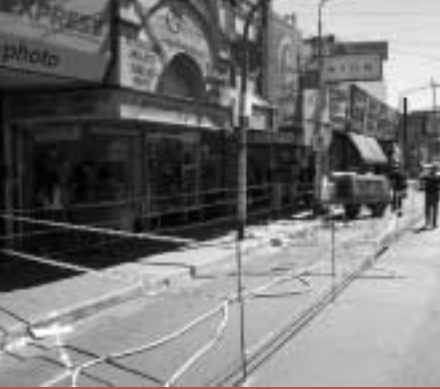
Jerarquización de áreas centrales