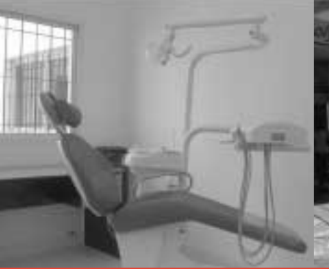
Equipamientos para la red de salud