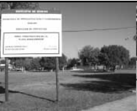
Mejora de espacios verdes