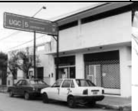
Apertura de nueva UGC