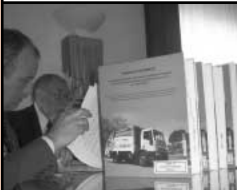
Compromiso de transparencia

13.000 Documentos fueron digitalizados en el archivo del Instituto Histórico comunal.