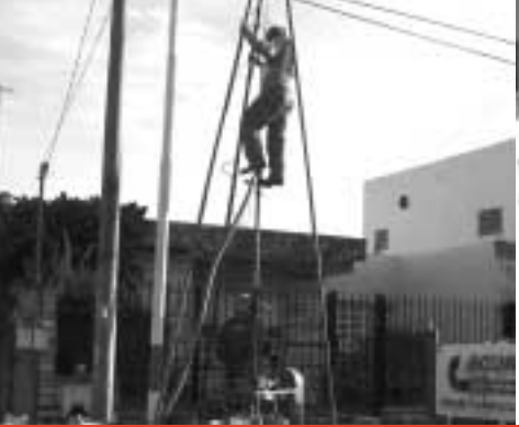
Instalación de bombas depresoras