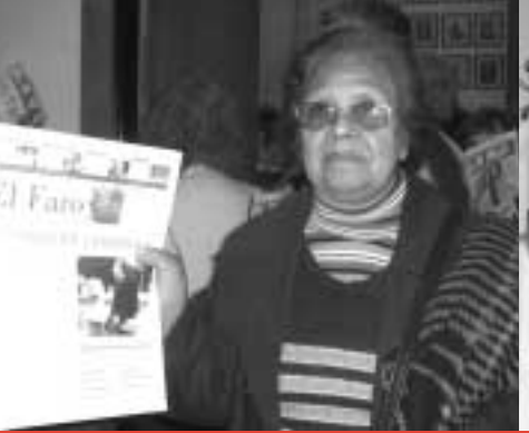
Publicación para adultos mayores