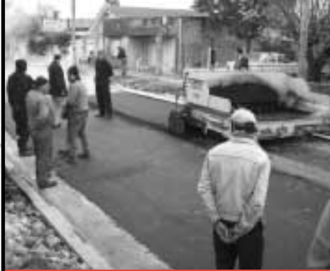
Asfaltos y bacheos en todo el partido