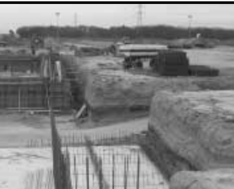
Construcción de planta cloacal