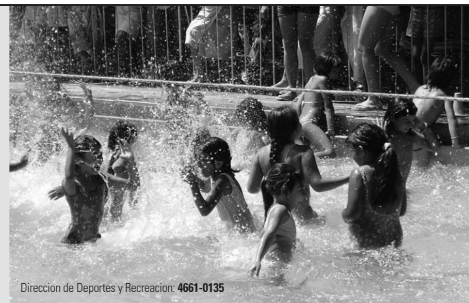
Dirección de Deportes y Recreación: 4661-0135

PLANETA OESTE. El domingo 23, a partir de las 15 hs., en la Plaza Los Españoles, Arrecifes e islas Malvinas, Castelar, se realizará un festival de bandas de la zona para presentar el disco "Planeta Oeste". El recital es el cierre de los festejos por los 20 años de la radio FM en Tránsito. La entrada es libre y gratuita.