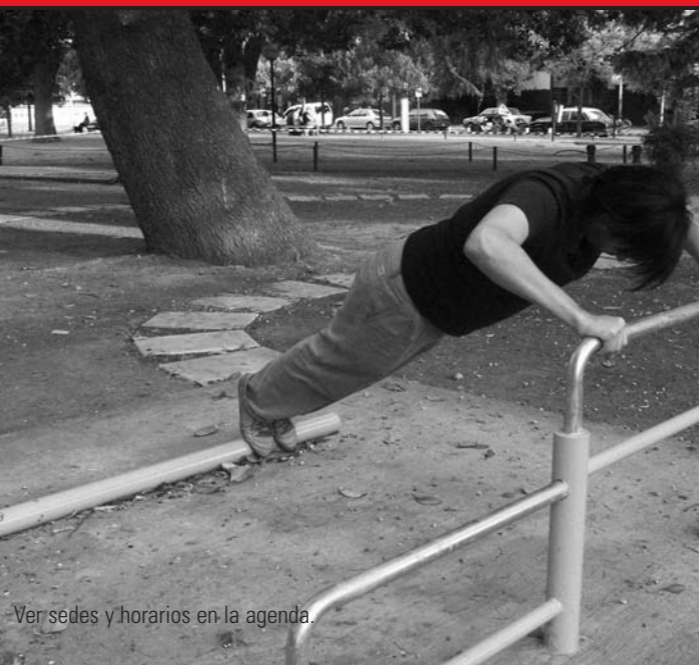
Ver sedes y horarios en la agenda.

Teatro, Plástica, Canto, Guitarra, Folclore, Tango, Historieta. UGC 5, UGC 6, Teatro Municipal, Soc. de Fomento 10 de agosto.