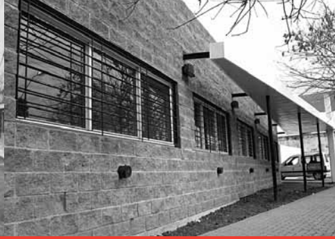
Nueva sede de la UGC 5