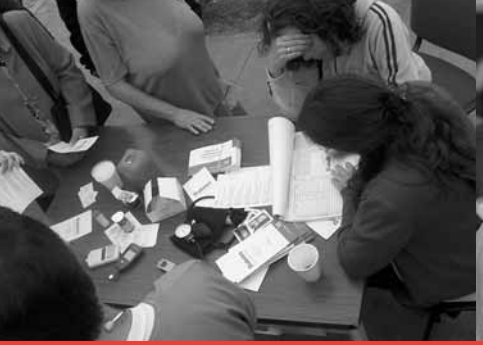
Programas de Prevención