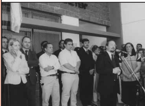
Jardín N° 14

La Red de Mercociudades fue fundada en 1995 con el objetivo de favorecer la participación de los municipios en el proceso de integración regional.