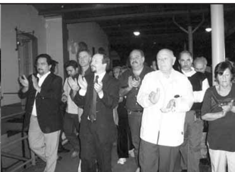
Abrazo estación de Haedo