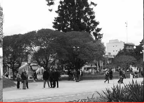
Plaza General San Martín