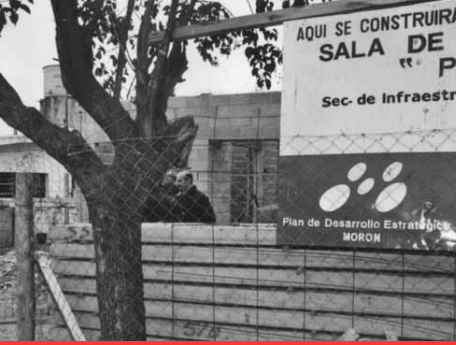
Sala Pte. Ibáñez