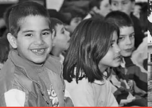
Atención a la niñez