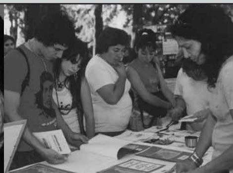
Juventud y adolescencia