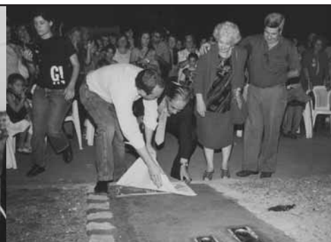
Memoria y Derechos Humanos