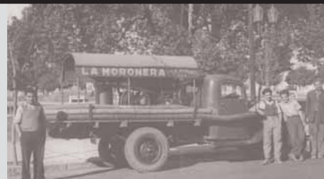
Viejo camión de la Moronera.

a todos los vecinos y vecinas que mandan sus fotos para ilustrar la tapa de este boletín. A aquellos que todavía no han visto publicada la suya, les pedimos un poquito de paciencia, ya que son muchas las que mes a mes nos llegan. Aprovechamos esta edición para publicar una tanda que aún no había sido publicada y para desearles que pasen unas felices fiestas y que tengan un muy buen 2007.