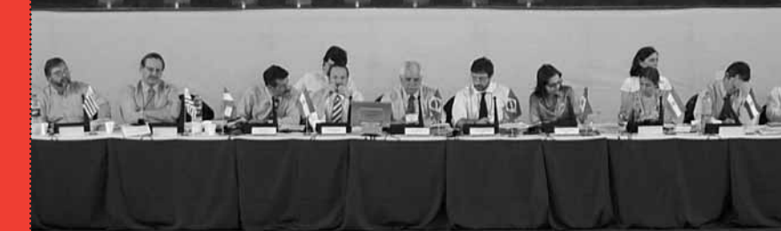
Histórico: Morón sede de la Cumbre de Mercociudades.

Alte. Brown 946 Morón - B1708EFR Tel.: 4489 - 7777 (Computador - Líneas rot.) 0 - 800 - 666 - 6766 (Oficina de Atención al Vecino • Línea gratuita). www.moron.gov.ar moron@mun.gba.gov.ar