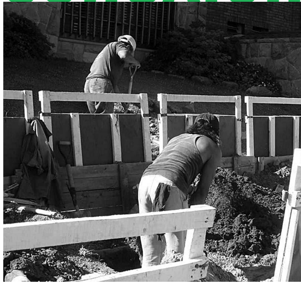
Trabajos en El Palomar en el marco del Plan de Saneamiento.

Los afluentes domiciliarios tendrán como destino la Planta de Tratamiento de Líquidos Cloacales inaugurada en Hurlingham en abril de este año que, en una primera etapa, prestará servicio a 150 mil vecinos. Paralelamente a esto la comuna trabaja en la contratación de los servicios de ingeniería para la concreción del sistema de redes cloacales domiciliarias