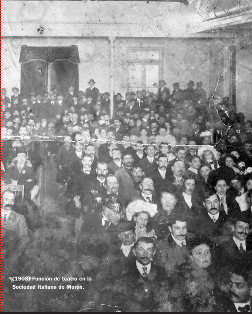
(1908) Función de teatro en la Sociedad Italiana de Morón.

Alte. Brown 946 Morón - B1708EFR Tel.: 4489 - 7777 (Commutador - Líneas rot.) 0 - 800 - 666 - 6766 (Oficina de Atención al Vecino • Línea gratuita) www.moron.gov.ar moron@mun.gba.gov.ar