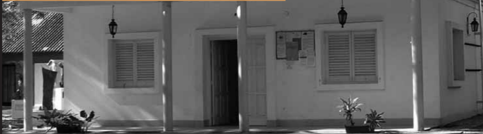
Casa de la Memoria y la Vida | (Santa María de Oro 3530, Castelar)

10° aniversario de la Casa de la Memoria y la Vida Encuentro de la Red Federal de Sitios de la Memoria