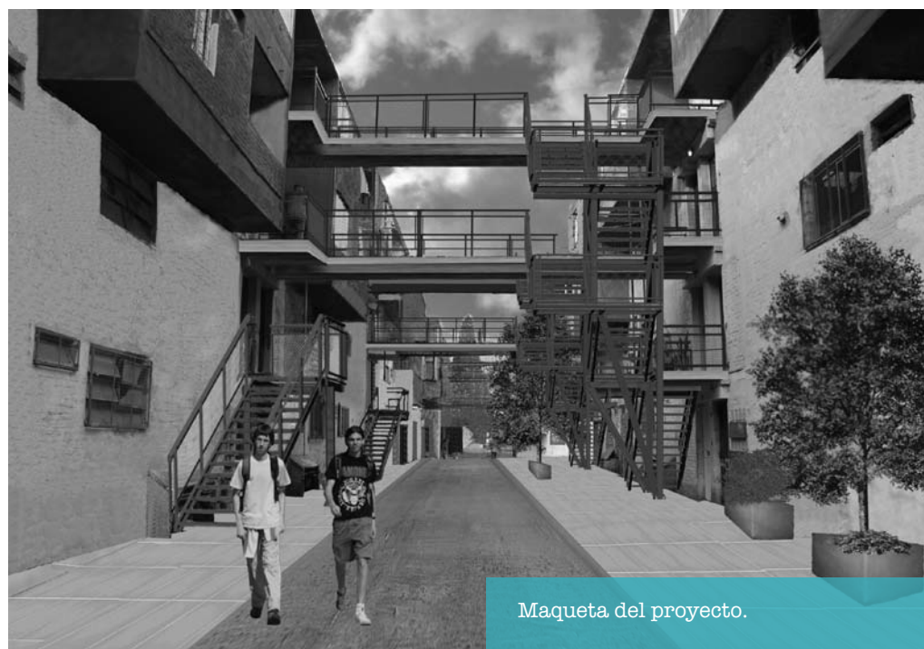
Maqueta del proyecto.

Las actuales serán reemplazadas, al igual que las barandas de protección y las pasarelas. Además, habrá nuevas luminarias y buzones para los departamentos.