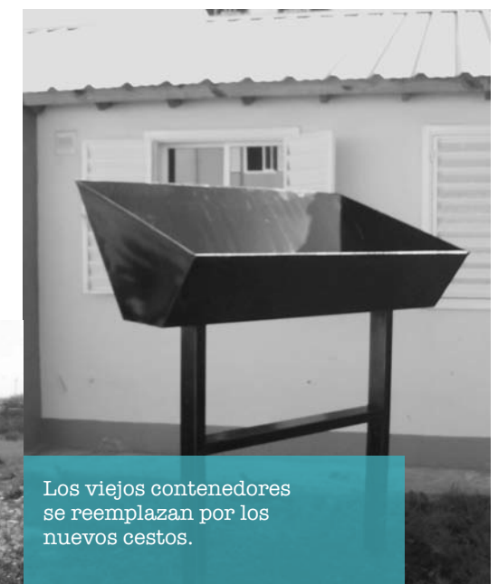
Los viejos contenedores se reemplazan por los nuevos cestos.

A partir del mes de agosto se implementará el nuevo sistema de recolección de residuos en los monoblocks y en el sector de las casas, a partir del cual se reemplazarán los contenedores actuales -16 unidades- por cestos de menor tamaño que estarán colocados en mayor cantidad de lugares. La recolección se realizará de forma manual y los camiones pasarán de lunes a sábado entre las 7 y las 8 hs. De esta manera, se aumentará prácticamente el 50% de la capacidad de contener residuos, con el objetivo de que los cestos no se vean sobrepasados y que la basura no se amontone en espacios comunes. Los cestos, que estarán ubicados en puntos estratégicos, fueron elegidos por los vecinos y veci-