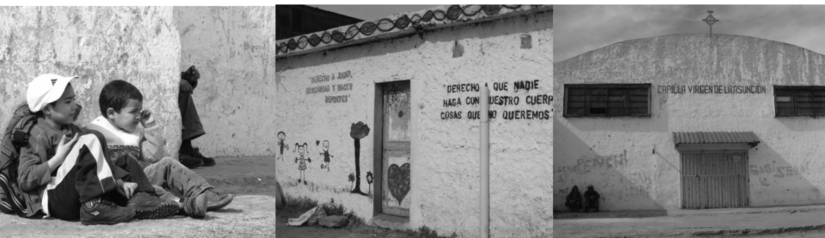
COC. Lunes a viernes de 9 a 14 hs. Carlos Gardel 188. Teléfono: 4654-3565. E-mail: soygardel@moron.gov.ar

Comunidad Virgen de la Asunción. La Capilla