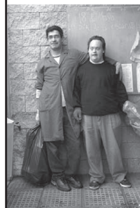
Año 2 Número 8 Sept.-Octubre de 2010 Boletín bimestral para vecinos y vecinas de los barrios Carlos Gardel y Presidente Sarmiento